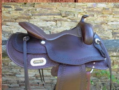
Cuire de vache couleur choco