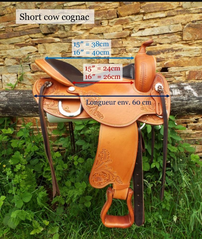
Short cow cognac